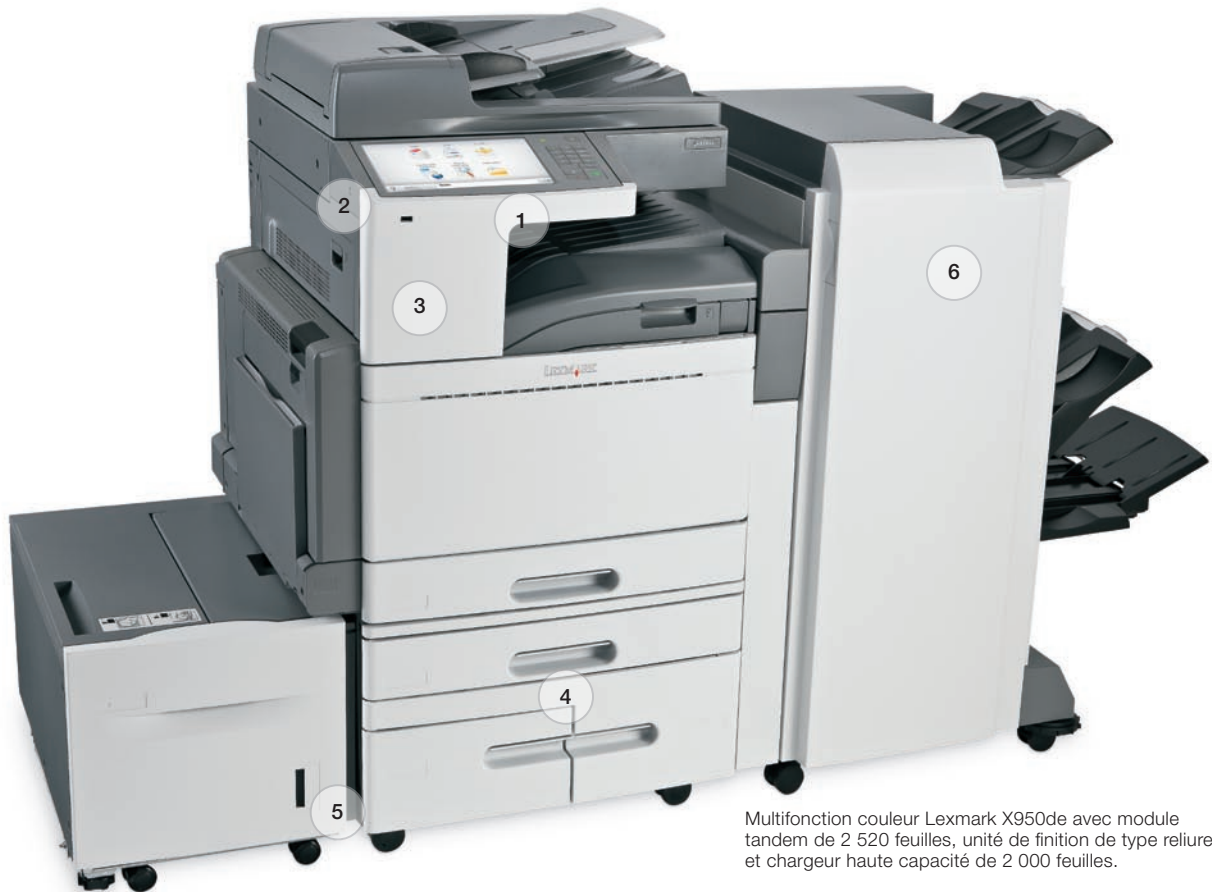
Multifonction couleur Lexmark X950de avec module tandem de 2 520 feuilles, unité de finition de type reliure et chargeur haute capacité de 2 000 feuilles.